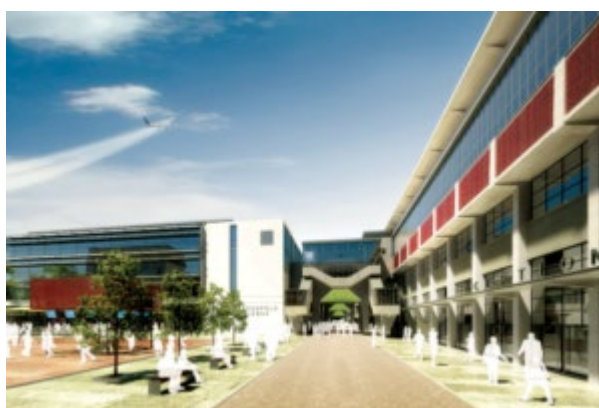
Il progetto del Big Data Technopole

Gli obiettivi principali dell'Ifda sono cinque. Il primo è lo sviluppo delle conoscenze del supercalcolo e