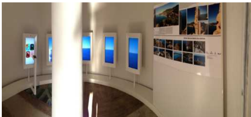
Fig. 1- Allestimento museale nella Torre di Chia (ISEM-CNR - 2013)

Il progetto dell'ISEM "Torri Multimediali, la torre come interfaccia", che ha visto nella torre di Chia (CA) il primo allestimento museale curato dal nostro Istituto ne è un esempio e la presente idea progettuale potrebbe essere una sua evoluzione.