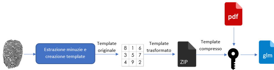
Fig. 2 Schema di funzionamento del prototipo

Il template descrive in maniera puntuale un'impronta digitale e poiché da esso è possibile ricreare l'impronta digitale da cui è stato estratto (Cao, Jain 2015), esso deve essere protetto. Come primo passo del modulo di protezione del template viene applicata una trasformazione cartesiana al template che permette di modificare la posizione delle minuzie (Nalini et al. 2007). Per implementare la trasformazione si utilizza una matrice che cambia periodicamente (aggiornando di conseguenza i file coinvolti), come si può vedere nella Figura 3. Il template trasformato viene successivamente compresso e inserito all'interno del file pdf.