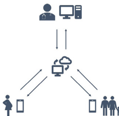
Fig. 1 Schema del progetto

L'intera piattaforma (certificata medicale 93/42/CE in classe IIA) sarà integrata in un da-