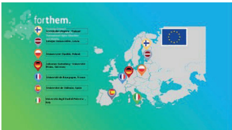
Fig. 1 L'Alleanza Forthem

Il Progetto Forthem (Fostering Outreach within European Regions, Transnational Higher Education and Mobility) è un partenariato di 7 università con sede in 7 stati membri dell'UE, coordinato dall'Università Johannes Gutenberg di Mainz (Germania) e fondato su esistenti competenze e collaborazioni multidisciplinari con i partner (dal nord al sud): Jyväskylä yliopisto (Finlandia), Latvijas Universitāte (Lettonia), Uniwersytet Opolski (Polonia), Université de Bourgogne (Francia), Universitat de València (Spagna), Università degli Studi di Palermo (Italia). Il progetto pilota, di durata triennale, è stato approvato nel 2019 1 .