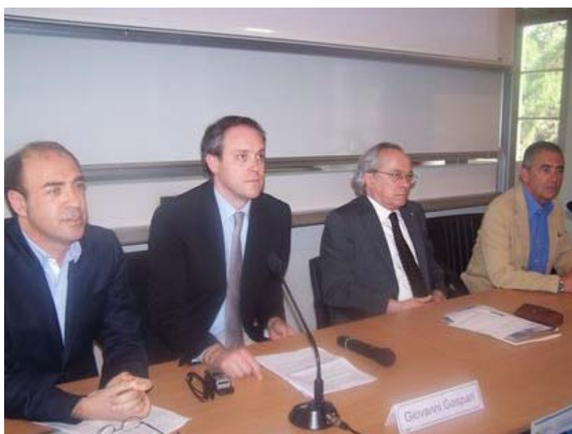
I relatori del convegno sulla fibra ottica

San Benedetto del Tronto | Reti in fibra ottica di nuova generazione: un'opportunità di crescita per il territorio.